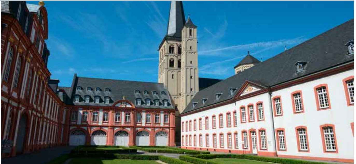
Die Abtei Brauweiler, Sitz des Rheinischen Amtes für Denkmalpflege mit den Restaurationswerkstätten