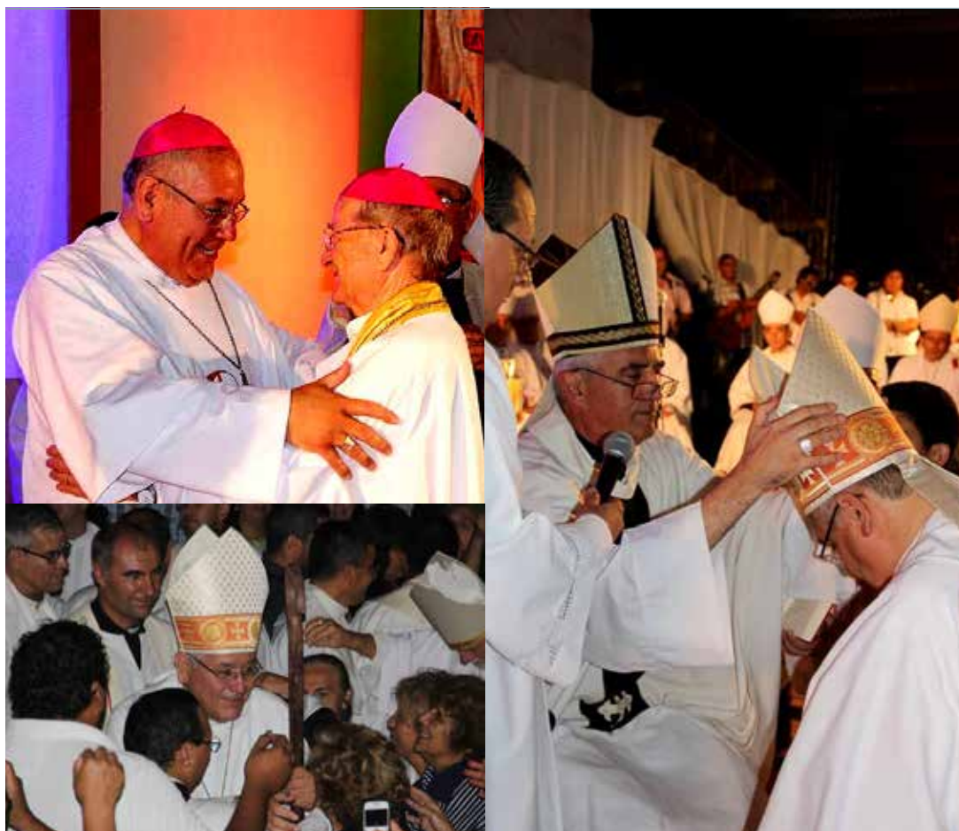
Im Uhrzeigersinn Bild 1: Gratulation durch Bischof emer. Antonio Baseotto, Bild 2: Einfüh- rung des neuen Bischofs Jose Meliton Chavez im Dez. 2015 durch Bischof Adolfo Uriona, Bild 3: Volksnähe.