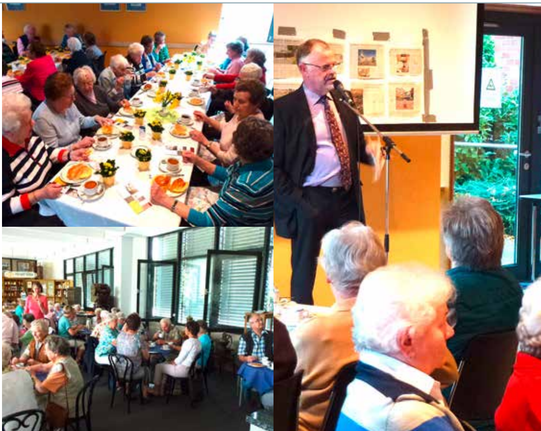
Im Uhrzeigersinn Bild 1: Treffen im April, Bild 2: Ausflug nach Emmerich, Bild 3: Treffen im November mit Bür- germeister Hans-Josef Linßen